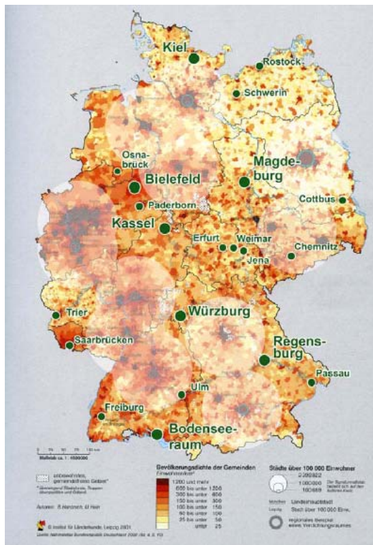
Abbildung 1: Erste kartographische Annäherung an Regiopolen